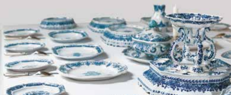
Prachtvoll gedeckte Tafel, Manufaktur Straßburg, um 1740